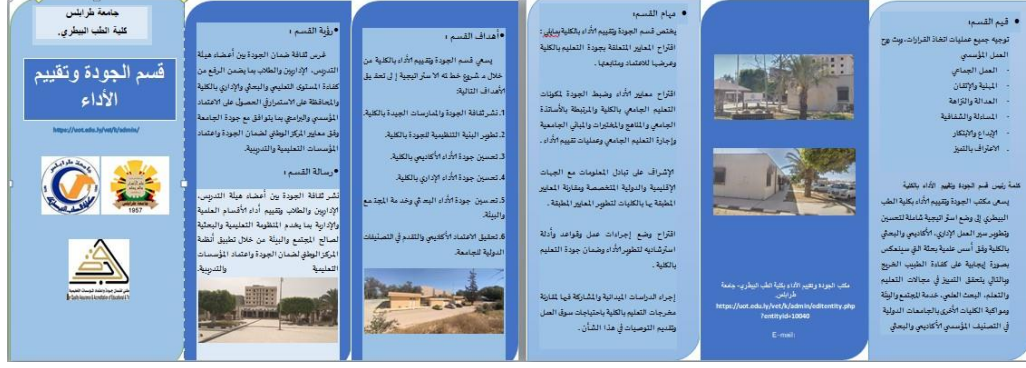
صورة (1): مطوية خاصة بالقسم